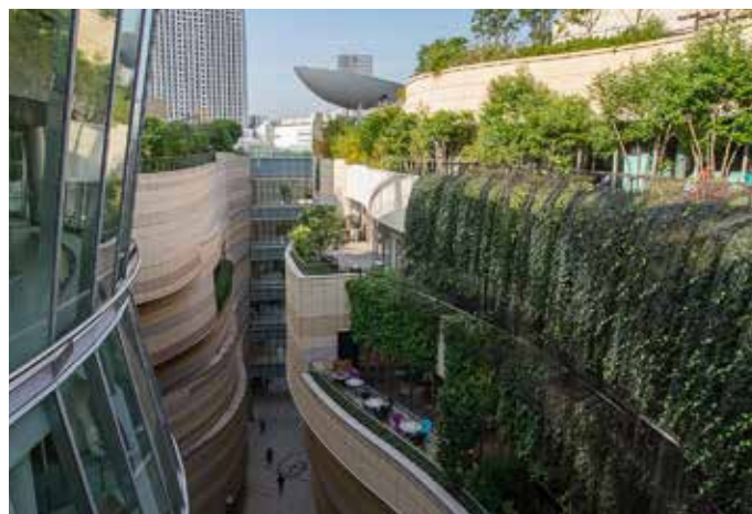
Namba Park i Osaka.