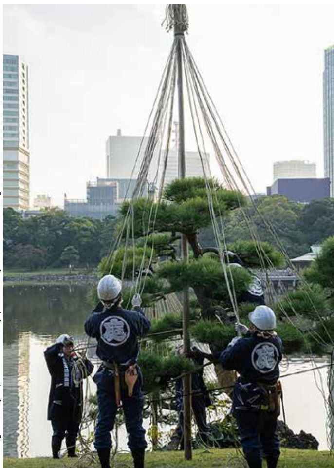
Montering av snöskydd på träd i Hama-Rikyu-parken i Tokyo.