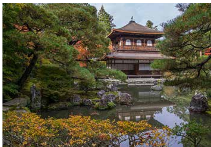
Silverpaviljongen i Kyoto.