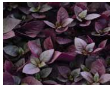
Althernatera dentata 'Purple Prince' eller 'Little Romance'