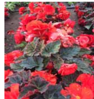
Begonia x tuberhybrida Nonstop Mocca Scarlet