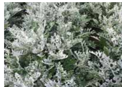
Senecio cineraria 'Silverdust'