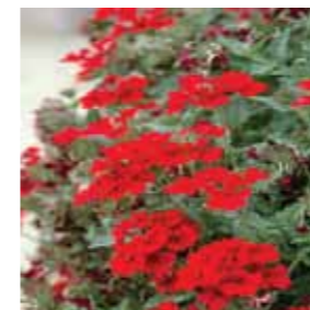
Verbena Vepita Scarlet eller V. selecta Lascar 'Dark Red'