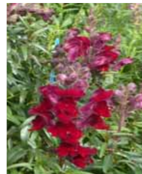
Antirrhinum majus 'Rocket Red'