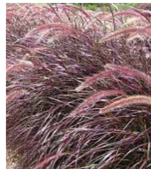
Pennisetum advena 'Rubrum'