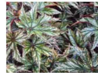
Begonia x hybrida 'Gryphon'